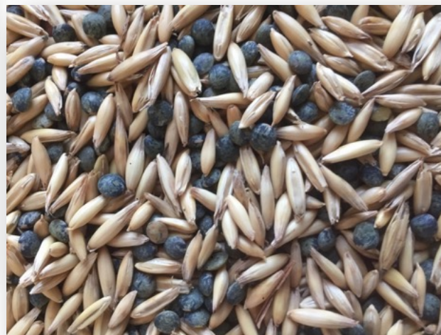
Innovations – Filières