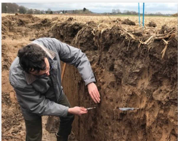
Diagnostic agronomique Ex: profil de sol