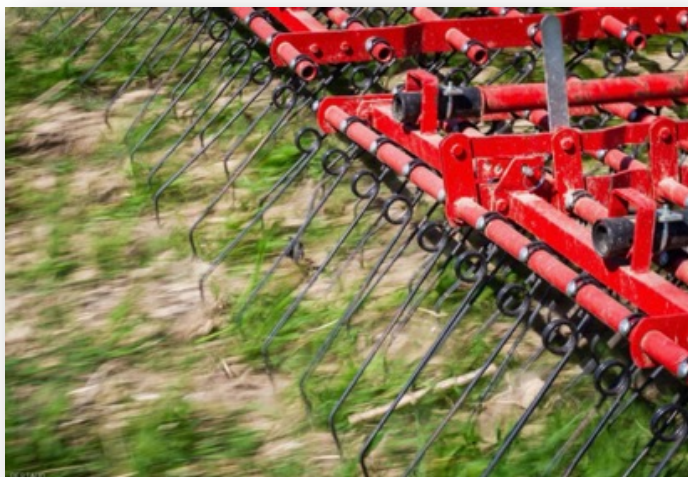
Équipement spécifique Ex: désherbage mécanique

Couverture permanente Perturbation minimale