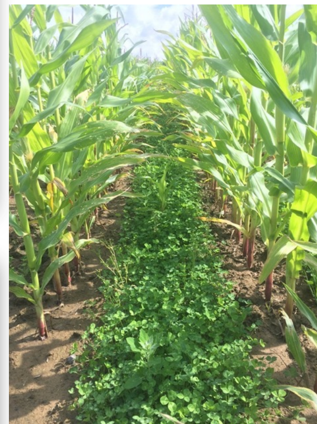
Couverture permanente des sols Ex: sous-semis de trèfle dans le maïs