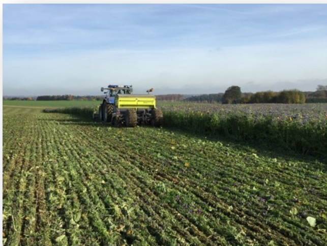
Perturbation minimum du sol Ex: semis direct sous couvert