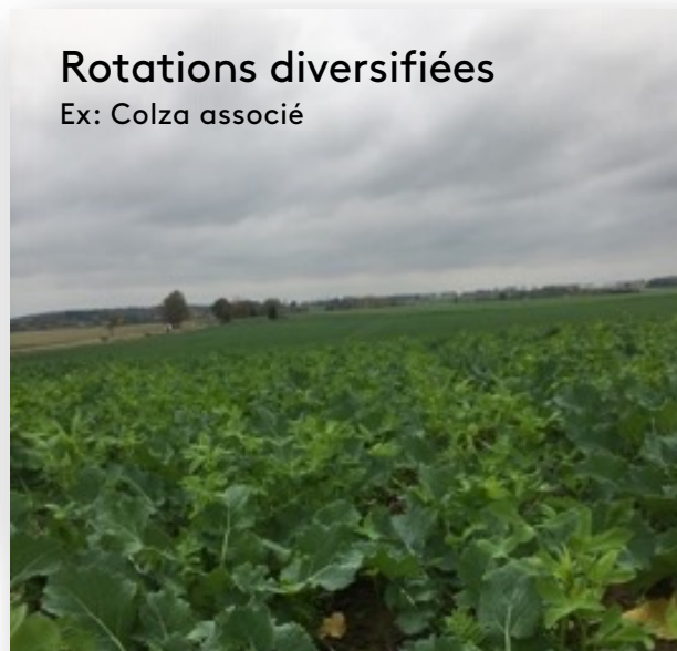
Rotations diversifiées Ex: Colza associé