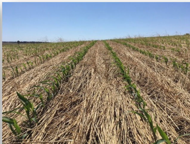
Implantation spécifique Ex: Maïs sous couvert sans labour

Couverture permanente Perturbation minimale