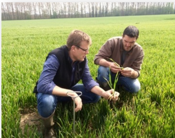
Optimisation des intrants