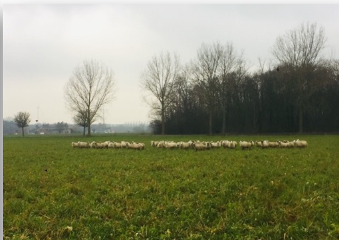
Intégration d'animaux Ex: pâturage de couverts