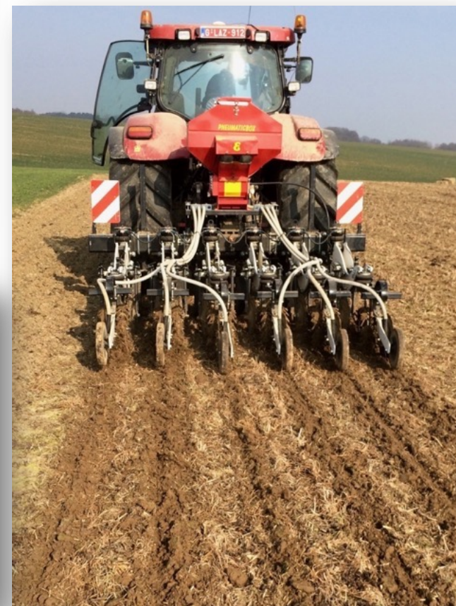
Équipement spécifique Ex: strip-till